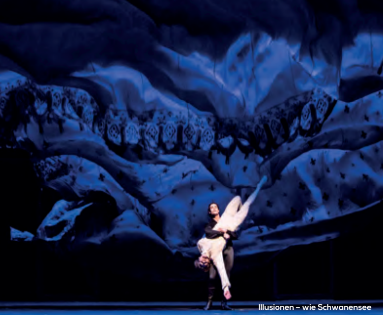
Illusionen – wie Schwanensee